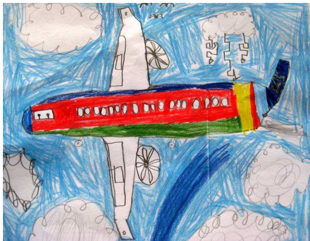
Torstein har flydd i sommer